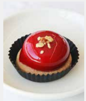
Dôme crémeux fraise