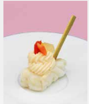
Pique - Cabillaud, légumes croquants et mayonnaise épicée