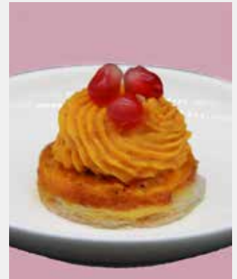
Sablé parmesan, patate douce et grenade

Sablé parmesan, patate douce et grenade ✓