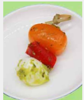
Brochette de légumes du soleil, pesto et mozzarella

Tramezzini - Thon épicé et crémeux avocat