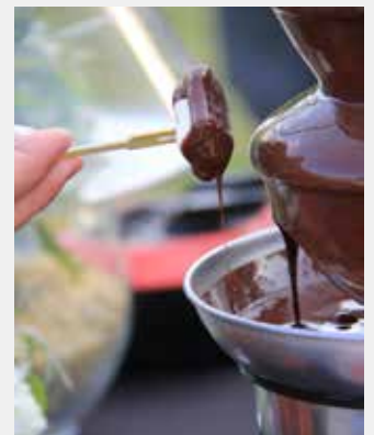
Fontaine à chocolat