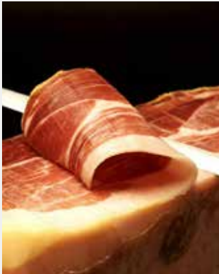
Découpe de Jambon Serrano