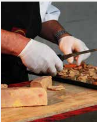
La découpe de Foie Gras de Canard