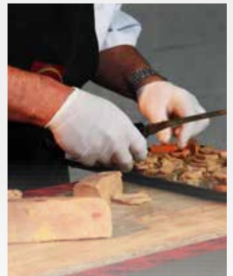
La découpe de Foie Gras de Canard

Un beau jambon Pata Negra de qualité supérieure découpé devant vos yeux, accompagné de pains spéciaux, de beurre et de condiments.