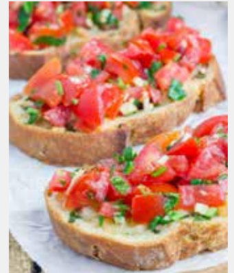
Balade en méditerranée