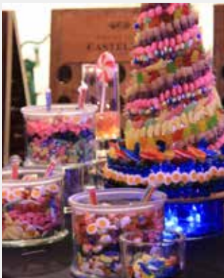
Candy Bar et pyramide de bonbons