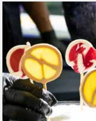
Les sucettes glacées